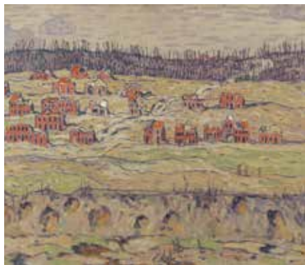
Illustration : A. Y. JACKSON, RIAUMONT, 1918 Collection Beaverbrook d'art militaire, Musée canadien de la guerre, Ottawa, Ontario, 19710261-0173

Renseignements : Direction de l'Événementiel au 03 21 50 69 05