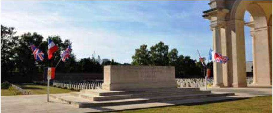
Comméoration écossaise au cimetière du Faubourg d'Amiens Cemetery, Mémorial d'Arras