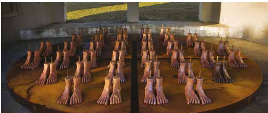
Illustration de l'exposition Coquelicot de la paix - Victory Medal