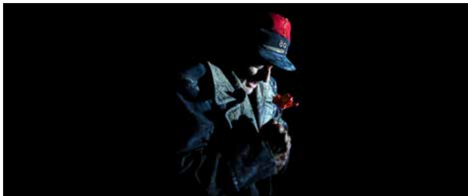
La fleur au Fusil