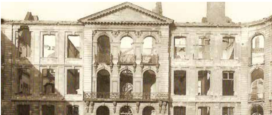
Cour du musée des Beaux-Arts d'Arras