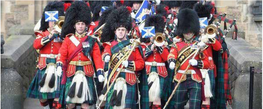
Beating Retreat and the Sunset Ceremony – Cérémonie du coucher du soleil